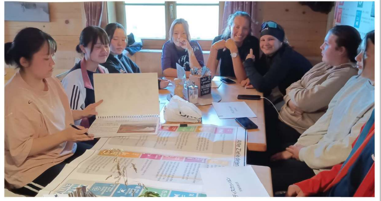
ドイツ団員とのディスカッション